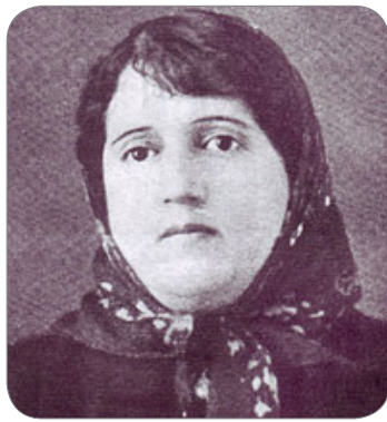
پرداخت. پروین پیش از چاپ دومین نوبت از

رخشنده- اعتصامی (۲۵ اسفند ۱۲۸۵ - ۱۵ فروردین ۱۳۲۰) معروف به پروین اعتصامی، شاعر ایرانی است که به عنوان «پروین پرآوازه‌ترین شاعر زن ایران» از او یاد شده‌است. پروین از کودکی فارسی، انگلیسی و عربی را نزد پدرش آموخت و از همان کودکی زیر نظر پدرش و استادانی چون دهخدا و ملک‌الشعراء بهار سرودن شعر را آغاز کرد. پدر وی یوسف اعتصامی آشتیانی، از شاعران و مترجمان دوران خود بود که در شکل‌گیری زندگی هنری پروین و کشف توانایی‌ها، و ذوق و گرایش وی به سرودن شعر نقش مهمی داشت. او در بیست و هشت سالگی ازدواج کرد، اما به دلیل اختلاف فکری با همسرش، پس از چندی از او جدا شد. پروین پس از جدایی، برای مدتی در کتابخانه دانشسرای عالی تهران به شغل کتابداری به کار